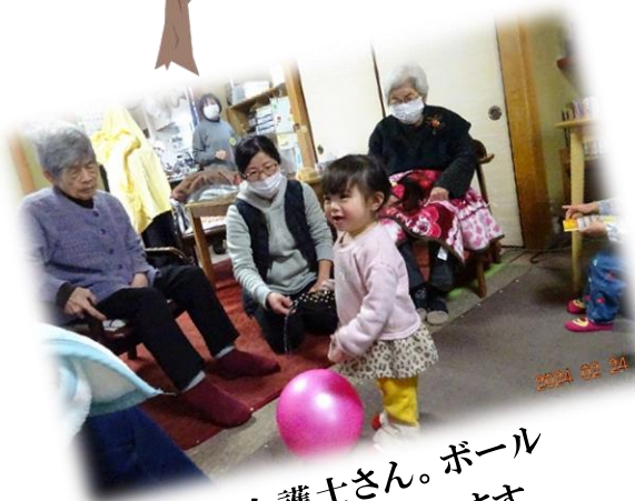
可愛い介護士さん。ボール遊びのご指導をしています