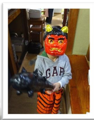
鬼のパンツは いいパンツ♪ 強いぞう 強いぞう (^_^)