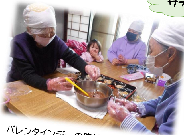
バレンタインデーの贈り物のチョコをチョコっと作っています。