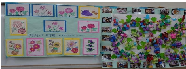
サテライト三日市場の展示