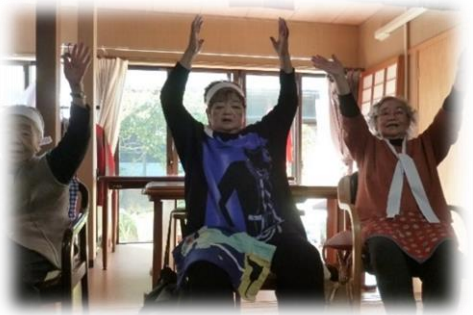
↑白組が勝ち！万歳！ 《三日市場》