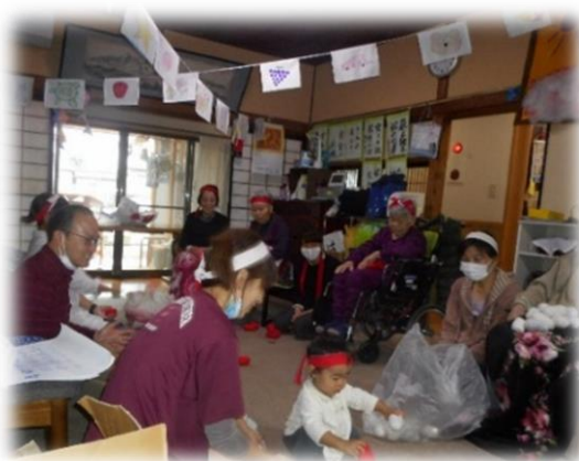
↑きよまさ君も参加して《松島》