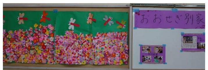
おおせぎ別家の展示