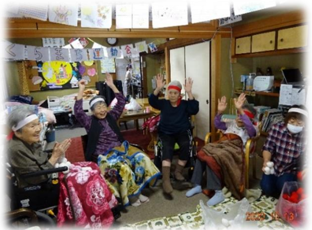
↑玉入れ、同点かな??万歳 《さくらまち》