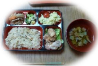
↑運動会弁当！ 美味しく頂きました。