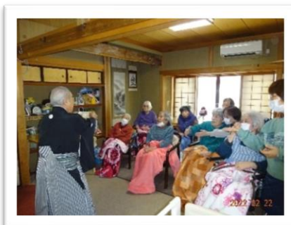
さて何が出来たのでしょうか