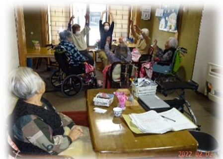
体操する人それを見る人