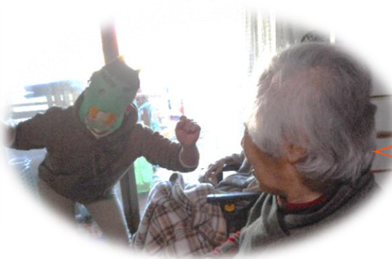
松島の鬼退治 青鬼は優しいそう 赤鬼は何が有って も動じません。

コロナとのお付き合いが随分と長くなりました。勝つ事はできませんが負けるわけにはいかない「共生」しか考えられません。今、職員一同、活動を止める事は出来ないと頑張っています。「生きる」という事がどういう事なのか、「幸せ」が何なのか考えてしまいます。