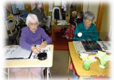
書道教室 板についた筆さばき